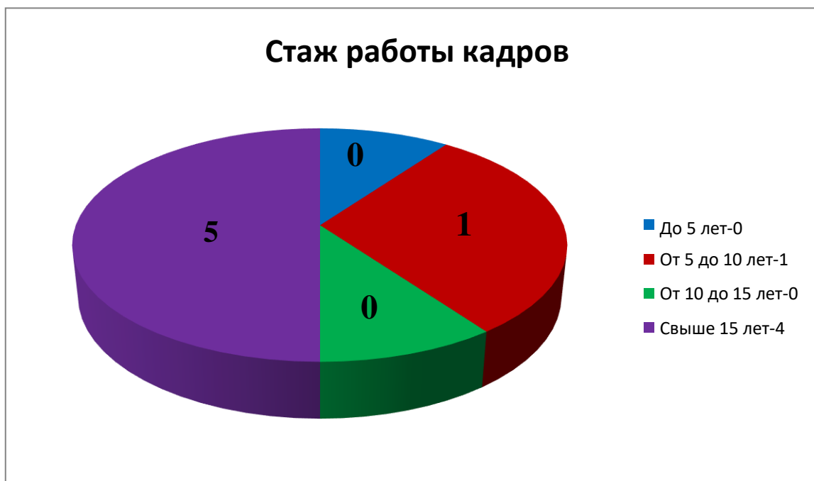
Диаграмма с характеристиками кадрового состава детского сада

По итогам 2023 года детский сад перешел на применение профессиональных стандартов. Педагогические работники детского сада все соответствуют квалификационным требованиям профстандарта «Педагог». Их должностные инструкции соответствуют трудовым функциям, установленным профстандартом «Педагог».